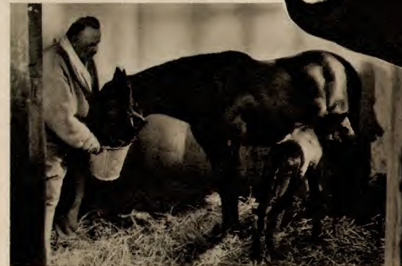
Noch ahnt das kleine Fohlen nicht, wie schwer und wie schön es seinem jungen Herrn einmal das Leben machen wird.